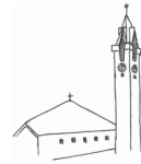
St. Antonius Eins., Bremke