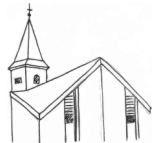
St. Cäcilia, Wenholthausen