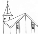
St. Cäcilia, Wenholthausen