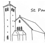
St. Sebastian, Salwey